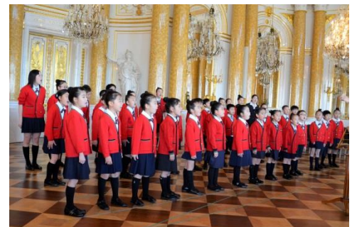
ポーランド演奏旅行(旧王宮にて)

幼児期から音楽教育を受けた子供達は、鈴の音が鳴るような天使の声で歌います。こんな可愛い子供たちと一緒に音楽を追求しませんか？音楽を学んだあなたの活躍の場がここにあります！ご応募、お待ちしております！