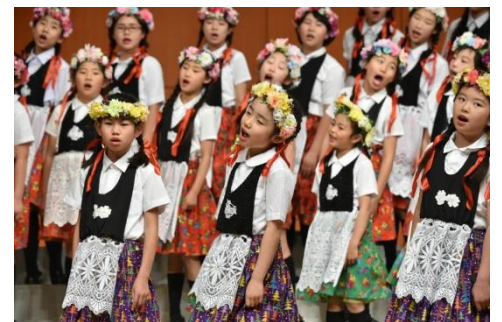
クリスマスコンサート(小学生クラス)