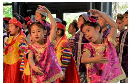
シルクロードプログラム(中国の踊り)