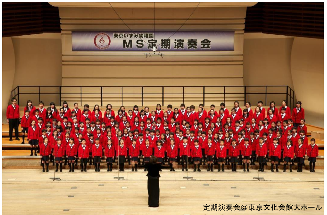
定期演奏会@東京文化会館大ホール